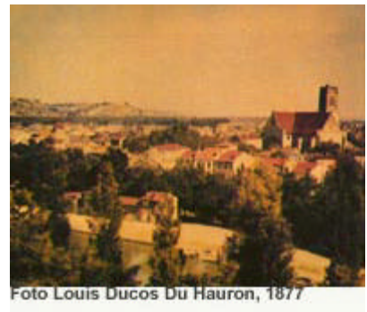
Foto Louis Ducos Du Hauron, 1877

1869 offentliggjorde fransmannen, pianisten Louis Ducos du Hauron (1837-1920), det viktigaste bidraget till färgfotografins utveckling under 1800-talet. I sin bok " Les Couleurs en Photographie, Solution du Problème " framlade han den subtraktiva metoden för färgfotografi, dvs att pigment absorberar alla färger, utom sin egen, som reflekteras. Placeras exempelvis ett gult och ett rödviolett filter delvis över varandra, får man tre färger. Den 23 februari 1869 fick Ducos du Hauron, patent på metoden.